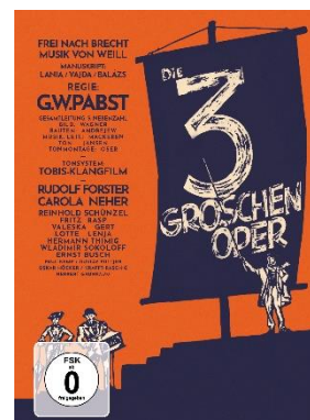
Die 3-Groschen-Oper von G.W. Pabst