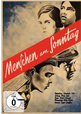
Menschen am Sonntag von Robert Siodmak