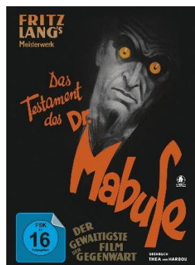
Das Testament des Dr. Mabuse von Fritz Lang