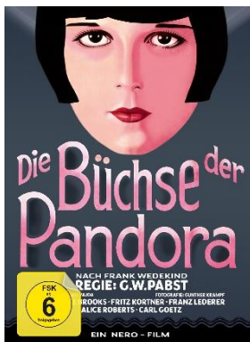
Die Büchse der Pandora von G.W. Pabst