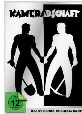
Kameradschaft von G.W. Pabst

Bei Fragen, Materialwünschen (Texte, Bilder, weitere Infos) oder Interviewwünschen mit der Deutschen Kinemathek zur Restaurierung und Geschichte des Films wenden Sie sich gerne an: